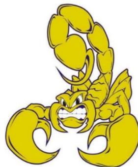
Preparatoria Bachillerato Dolores Huerta