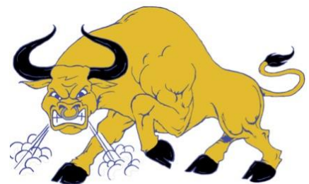
Escuela Intermedia Ersilia Cruz